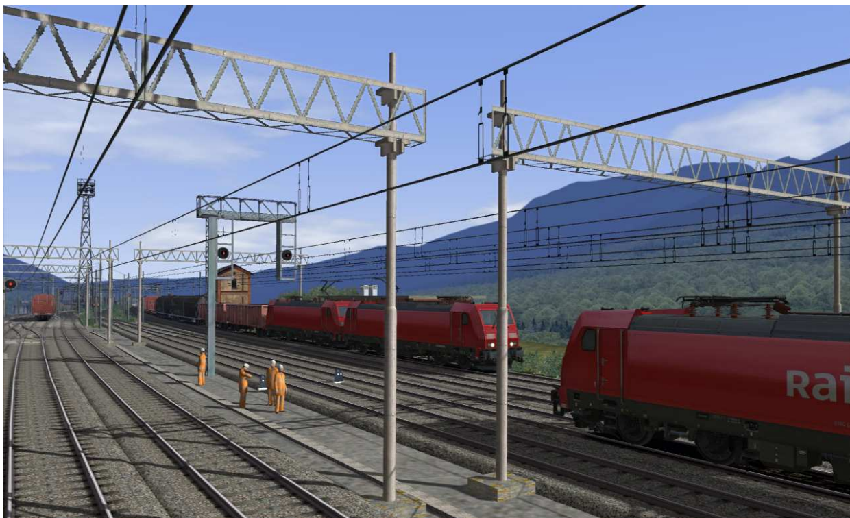
Alcune precedenze di ulteriori convogli merci diretti in Italia, una coppia di E 633 ed E 483 Nordcargo.